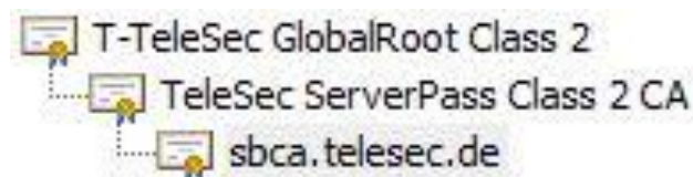
Abbildung 2: Übersicht der Zertifikatshierarchie des Webservers „sbca.telesec.de“

In Abbildung 2 ist die Zertifikatshierarchie des Web-Servers „sbca.telesec.de“ mit dem jeweiligen Zertifikat der Stammzertifizierungsstelle (Root-CA) und der untergeordneten Zertifizierungsstelle (Sub-CA) dargestellt.