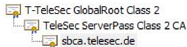
Abbildung 2: Übersicht der Zertifikathierarchie des Webservers „sbca.telesec.de“

In Abbildung 2 ist die Zertifikathierarchie des Web-Servers „sbca.telesec.de“ mit dem jeweiligen Zertifikat der Stammzertifizierungsstelle (Root-CA) und der Zwischenzertifizierungsstelle (Sub-CA) dargestellt.